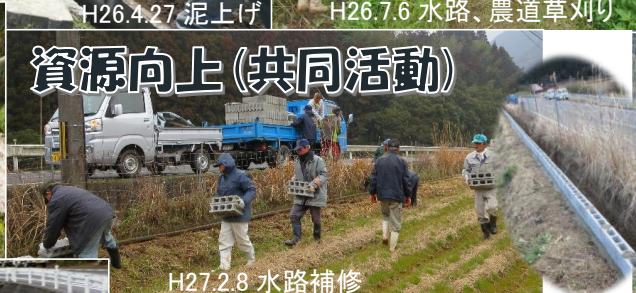
H27.2.8 水路補修(ブロック積)