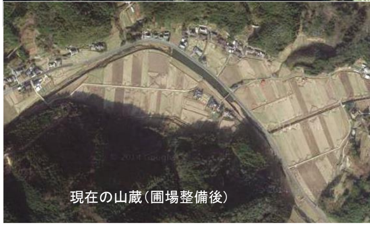
現在の山蔵(圃場整備後)