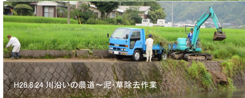
H26.8.24 川沿いの農道～泥・草除去作業