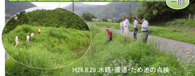
H26.6.29 水路・農道・ため池の点検