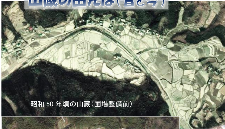
昭和 50 年頃の山蔵(圃場整備前)