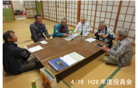
4/16 H28 年度役員会

H28.4.16 午後7時半より H27 年度定期総会が開催され、活動報告及び収支決算並びに本年度の収支予算・計画が原案通り承認可決されました。引き続き、役員会が開かれ、農用地の点検日程や、活動の周知を早めにするなど協議がありました。