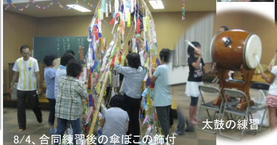
8/4、合同練習後の傘ぼこの飾付