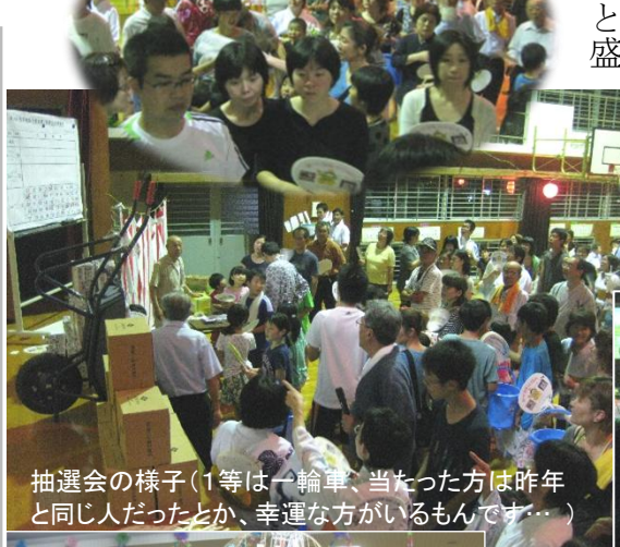
抽選会の様子(1等は一輪車、当たった方は昨年と同じ人だったとか、幸運な方がいるものであ...)