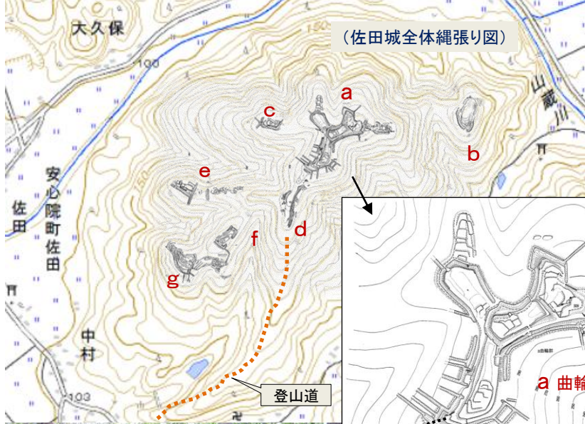
(佐田城全体縄張り図)