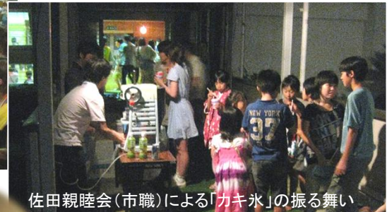
佐田親睦会(市職)による「カキ氷」の振る舞い