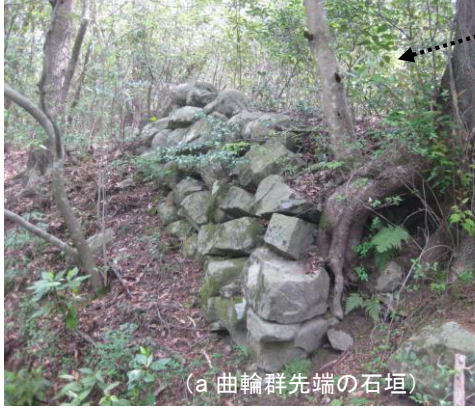
(a 曲輪群先端の石垣)