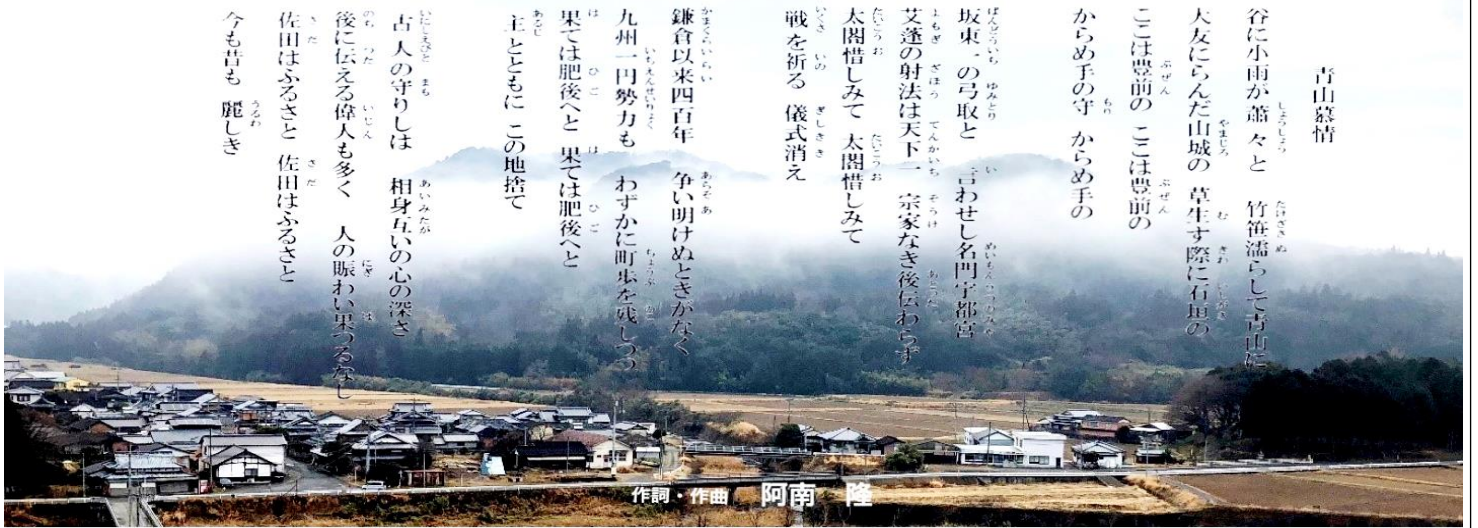
作詞・作曲 阿南 隆