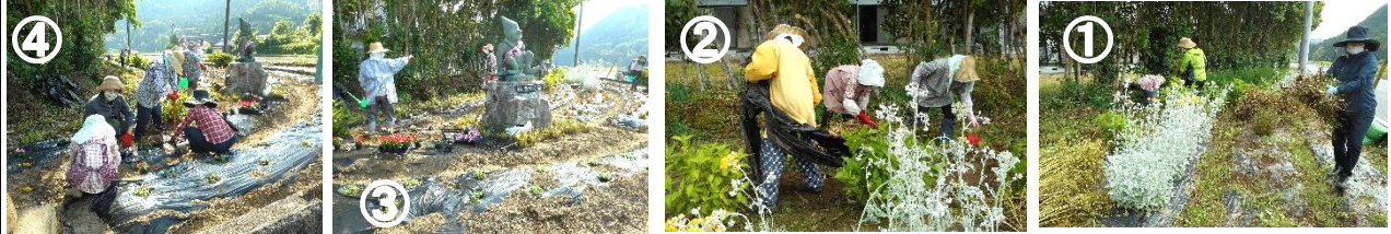
① ② 6/7の片付けの様子 ・ ③ ④ 6/8の植付けの様子 ・ ⑤ ⑥ はヒマワリの種をまく様子