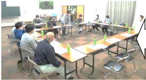
役員会の様子。遅くまでの審議お疲れ様でした