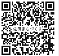
スマホでカラー版が見れます

雪がちらほらしています。めっきり寒くなった年の瀬。 今年の漢字が「密」に決まったように、新型コロナウイルスにかき回された1年でした。未だ終息する見通しが見えないところか、益々猛威を振るうありさま。 イベントのほとんどが中止となる中でも、まちづくり協議会を支えて下さった地区民の皆様のお蔭で、やるべき活動ができ無事に1年を終えようとしています。 本当にありがとうございました。 今後も新しい生活スタイルの実践でコロナに負けることなく、良い新年を笑顔でお迎えください。そして、くる年が皆様にとって幸多き年でありますように。 これからも佐田地区まちづくり協議会へのご支援、ご指導をよろしくお願いいたします。