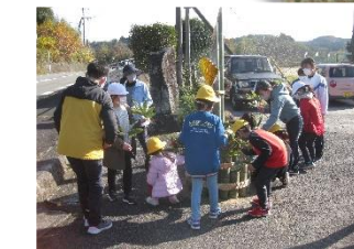
チーム佐田小 力を合わせて短時間で完成 みんなお疲れ様でした