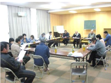
巨石祭の成功を期し、協議を 重ねる委員の方々