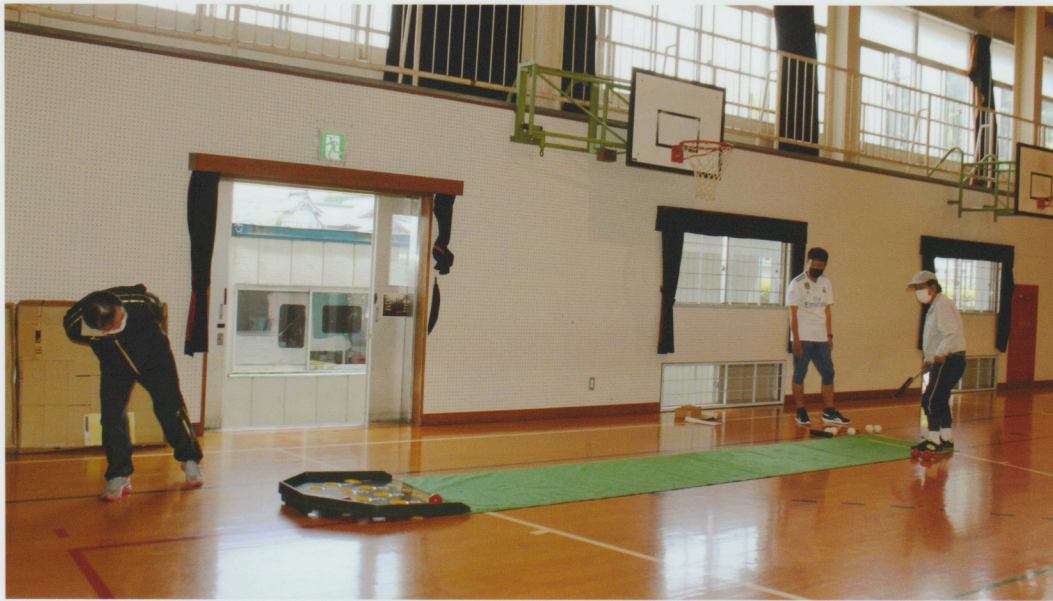
川添小学校体育館で行われたスカットボール

ボールをスタートラインからスティックで打ってスカット台の得点穴にボールを入れる競技です。