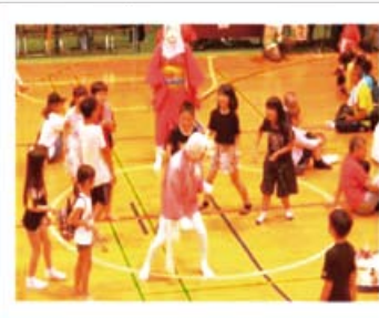
恒例のひょっとこ踊り

なのはなクラブのスポーツ少年団メンバーを中心に踊り子が青や赤の法被を身にまとい活きの良いソーランを披露してくれました。