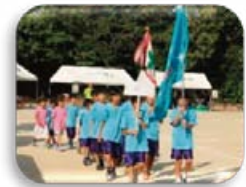
スポーツ少年団 バスケットボール