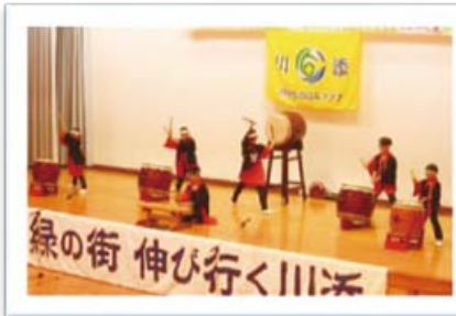
川添なのはな子ども和太鼓

ユーモラスな振り付けやお面の表情に子どもたちは大喜び。とりわけ狐のしっぽに子どもたちは魅力を感じ、群がります。追い払っても、追い払ってもしっぽ触りたがるんです。