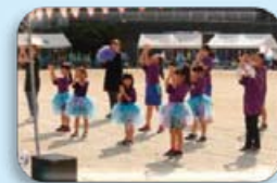
金谷・新田・浄土