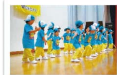
ヒップ・ホップ・ダンス

イベントに欠かせない存在です。歳を重ねた先輩が下の子ども達の指導を手伝いながら、年々上達しています。団員の成長を多くの方が応援しています。