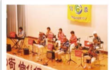
いそぎきビーチアンサンブル

昨年に引き続き、生きの良いヒップホップダンスを披露してくれました。年齢が上がるに伴い、動きがシャープで複雑になり、見る側も自然と身体が動き出します。若い人の躍動する姿は見ていて元気をもらいます。ありがとう。