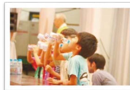
ラムネ早飲み大会

多くの子どもたちが参加しました。いつも以上に俊敏に行動できる子どもたちの姿はなしか？