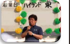
地元を代表 仲家市議