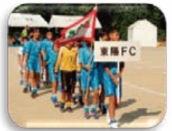
スポーツ少年団 サッカー