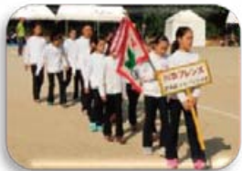
スポーツ少年団 新体操