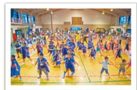
よさこいソーラン

多くの子どもたちが参加しました。普段の飲み物と勝手が違い、苦勞していましたが飲み干した時の笑顔はみんな「にっこり」