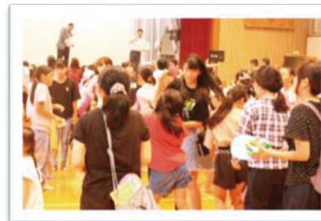
ちびっこ集まれ(お菓子まき)

多くの子どもたちが参加しました。いつも以上に俊敏に行動できる子どもたちの姿はなしか？