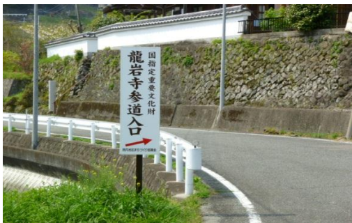
龍岩寺参道入り口案内板