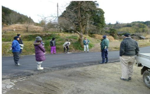
鳥獣被害対策集落点検状況