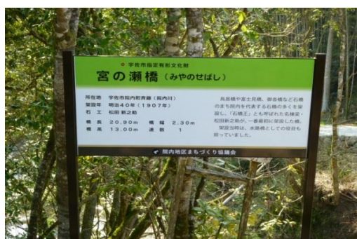
石橋案内板 宮の瀬橋