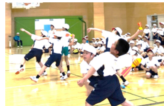
「スカットボールⅡ」でボール投げの練習をする5年生

みんなで黙々と両ひざをついて力を入れて磨き上げる姿に、つい、最高学年かと思間違えてしまいました。成長しています。