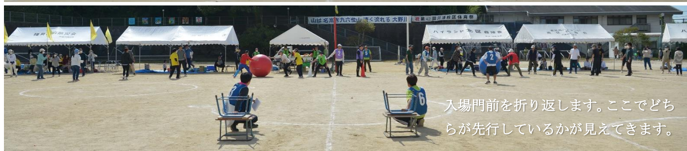
入場門前を折り返します。ここでどちらが先行しているかが見えてきます。