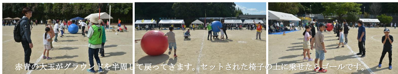
赤青の大玉がグラウンドを半周して戻ってきます。セットされた椅子の上に乗せたらゴールです。