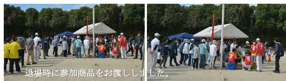
退場時に参加商品をお渡ししました。