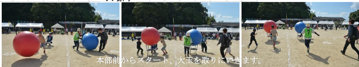
本部前からスタート、大玉を取りにいきます。

以前は、大玉を落とさないように、頭上で送っていましたが、転がすことでお子様でも参加でき楽しんで頂けたようです。