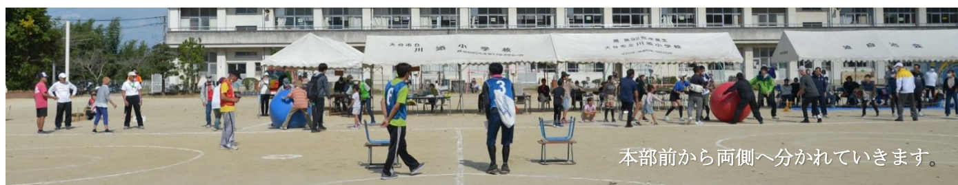
本部前から両側へ分かれていきます。