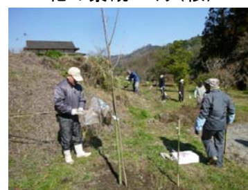
花の景観づくり(桜)