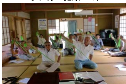
ふれあい健康づくり