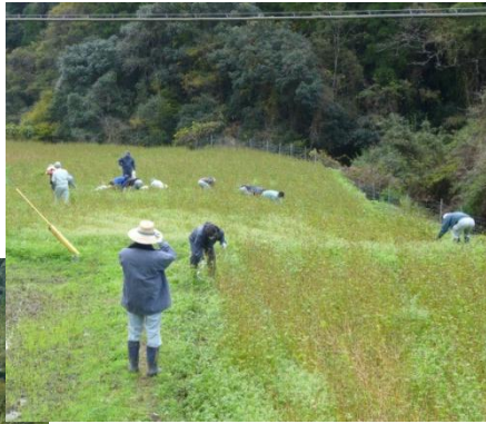
▲宮原地区のソバ刈り取り

月俣地区では、菜の花の種をまきました。平成二四年五月には黄色のじゅうたんが見られます。