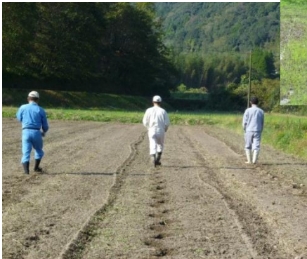
▼月俣地区の菜の花植え