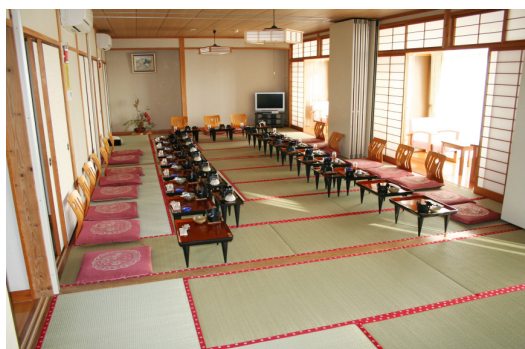
豊後梅・白梅・紅梅 (30畳間)