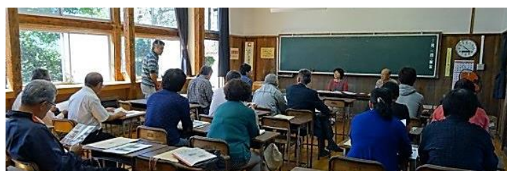
きらり水源村の研修の様子