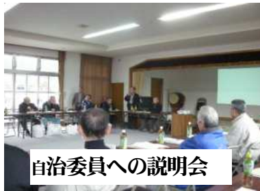
自治委員への説明会