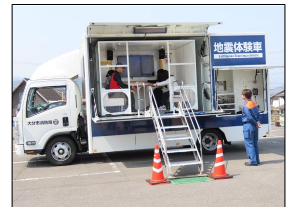
地震体験車で震度7の体験