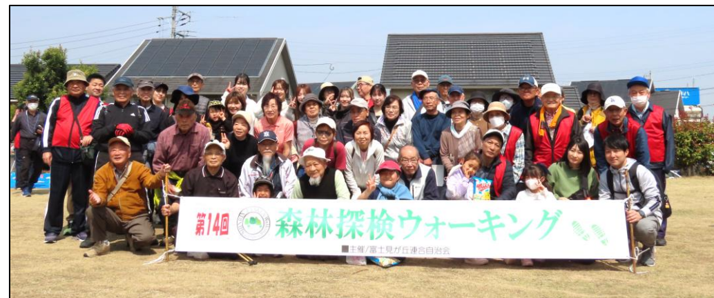
Bコース参加の皆さま