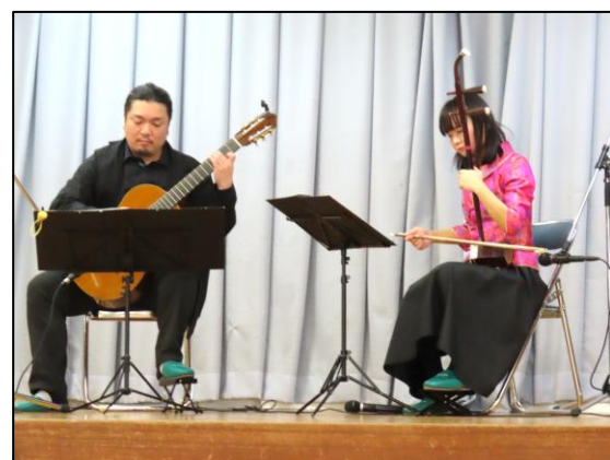
二胡とギターの二重奏