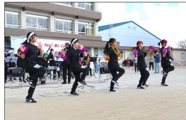
雄城台高校吹奏楽部の元気いっぱいのパフォーマンス