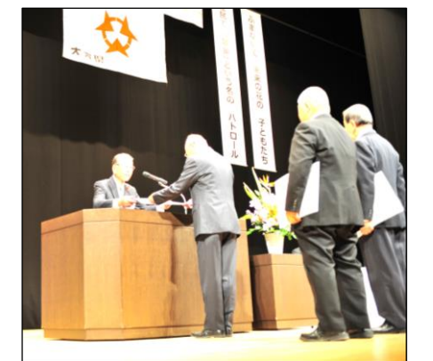
表彰を受ける川見防犯部長